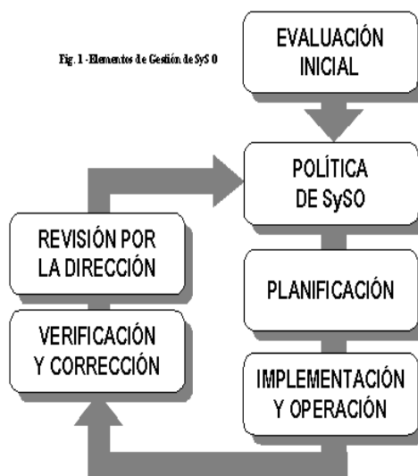
Fig. 1 - Elementos de Gestión de SySO